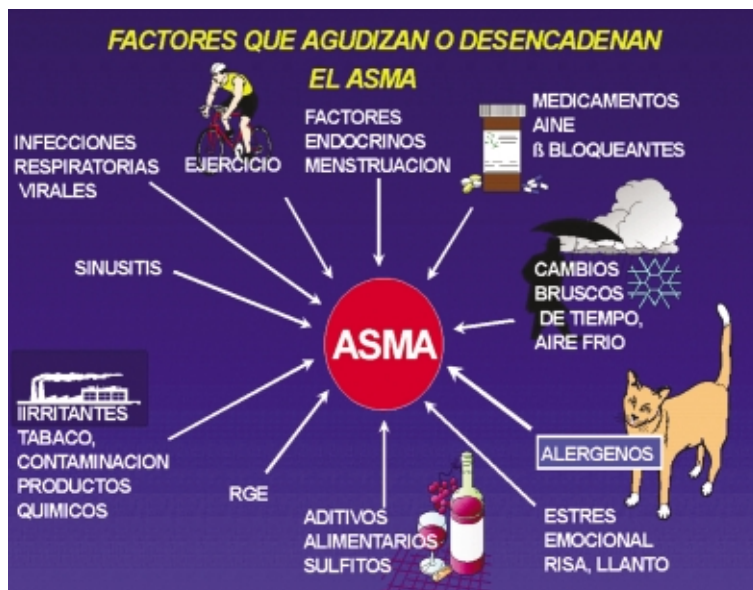
Figura 3. Factores que agudizan o desencadenan el asma.